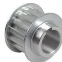
Rueda de correa de sincronización Cinturón de sincronización