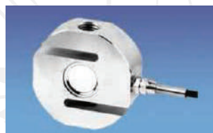
Sensor de fuerza América CELTRON