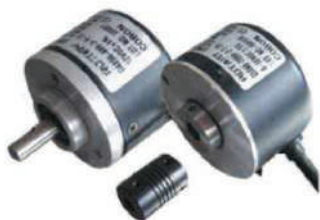
Medida de desplazamiento Dispositivo digital de fotoelectricidad Taiwan TECO high pulso (2500 r / p)