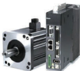
Unidad de control del motor paso a paso Taiwán TECH