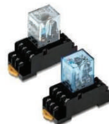
Relé Japón OMRON