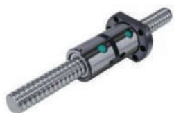
Varilla de tornillo Tornillo de bola de Taiwán HIWIN