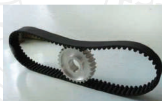
Cinturón de sincronización